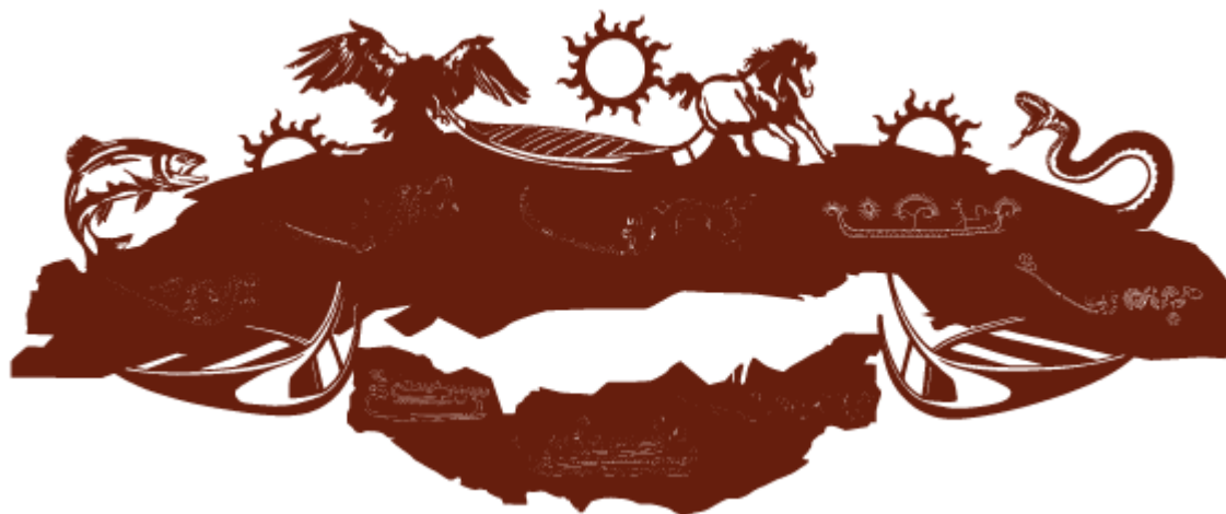
Figur 2 Illustration af solens rejse på væggen ved indgangen til Solvognens Fundsted

Tilbage på skolen kan I arbejde videre med temaet om Solvognen og ved f.eks. at lave jeres egne illustrationer/tegninger/collager af solens rejse over himlen om dagen og gennem underverdens mørke om natten. I kan også dykke ned i kildekritik og tage fat på fortællinger om hvordan Solvognen gik i stykker. Hvilken en er mest plausibel? Hvorfor?