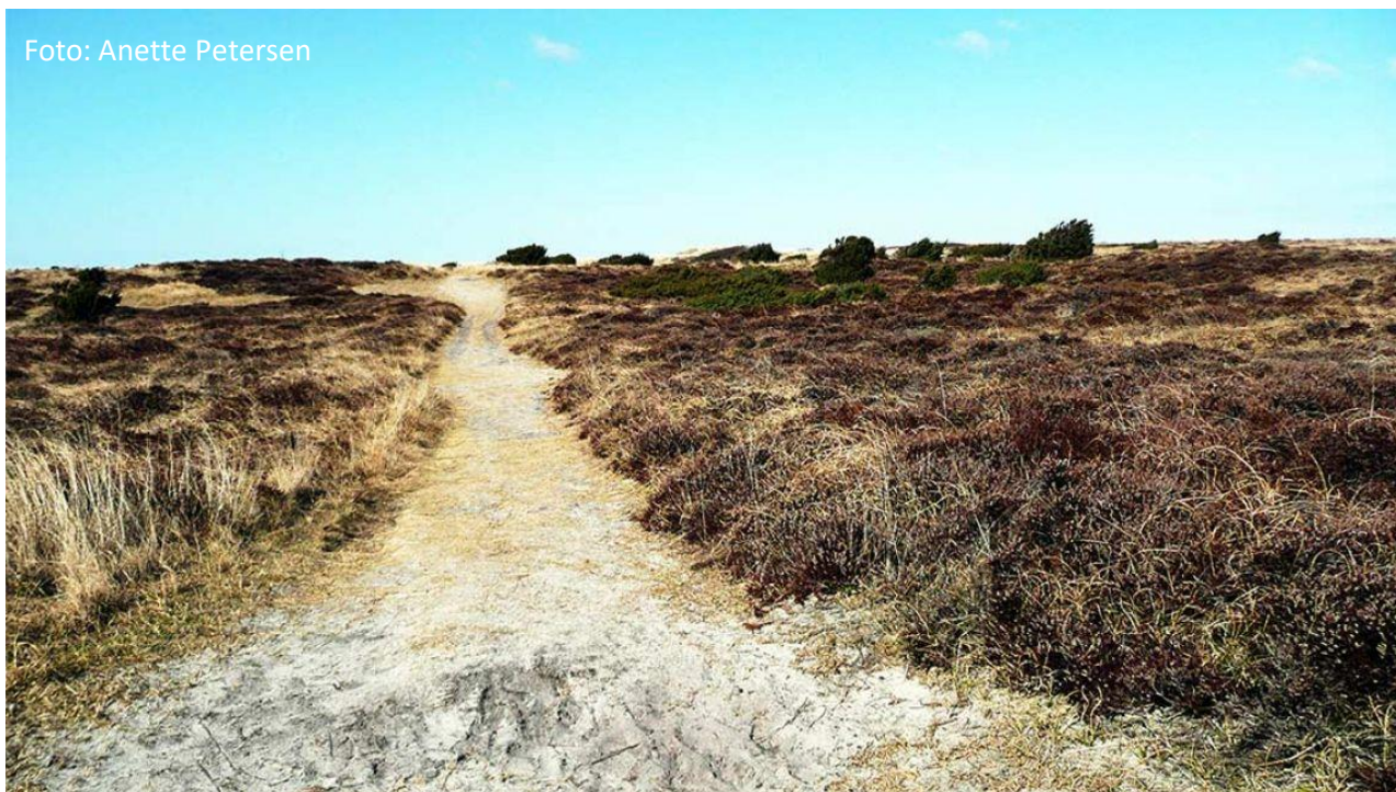
Korshage på Rørvig-halvøen